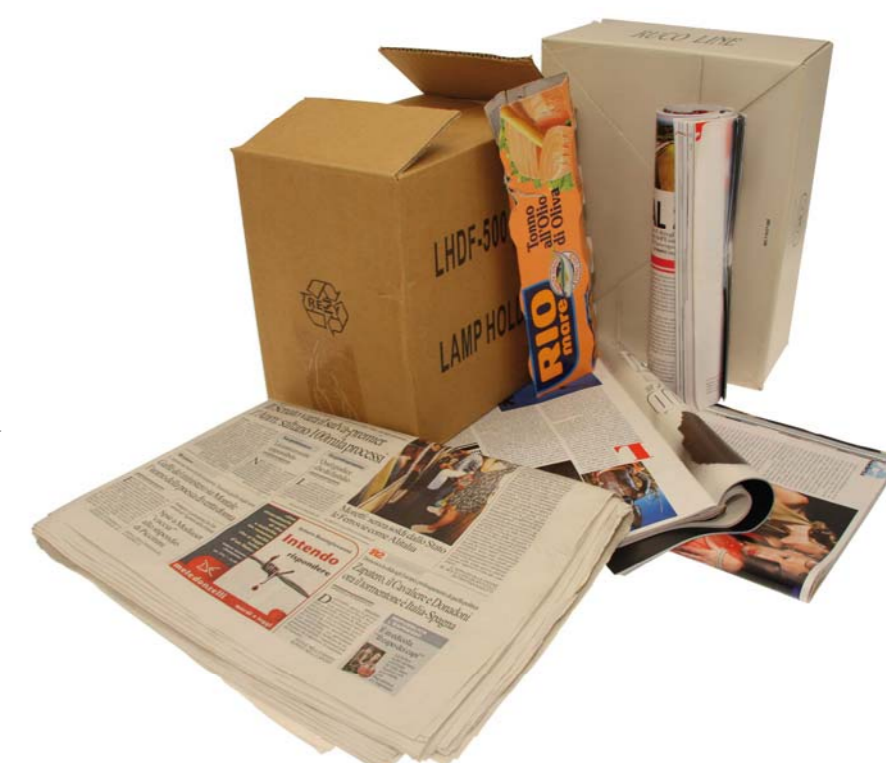
CASSONETTO CARTA E CARTONE