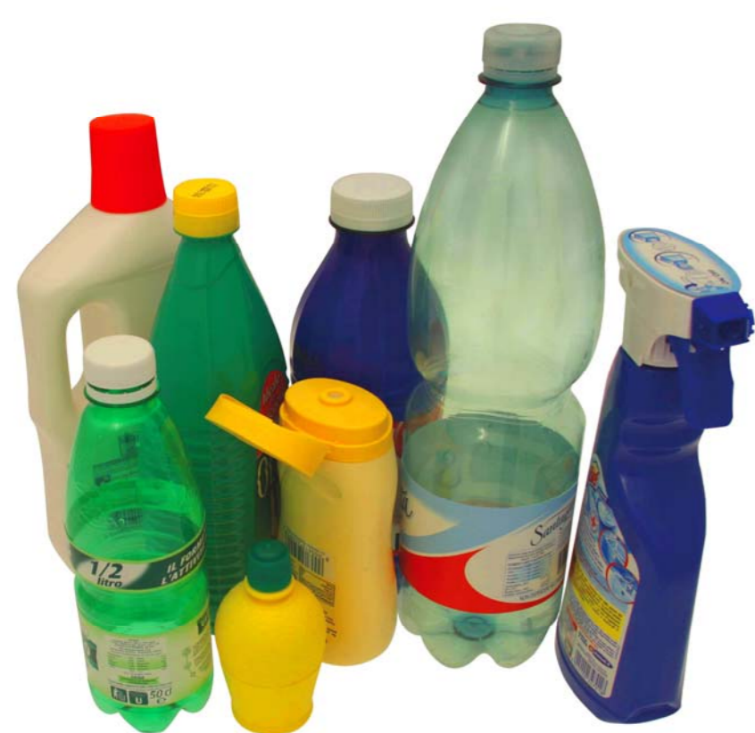
CASSONETTO IMBALLAGGI IN PLASTICA

i rifiuti riciclabili da questo cassonetto