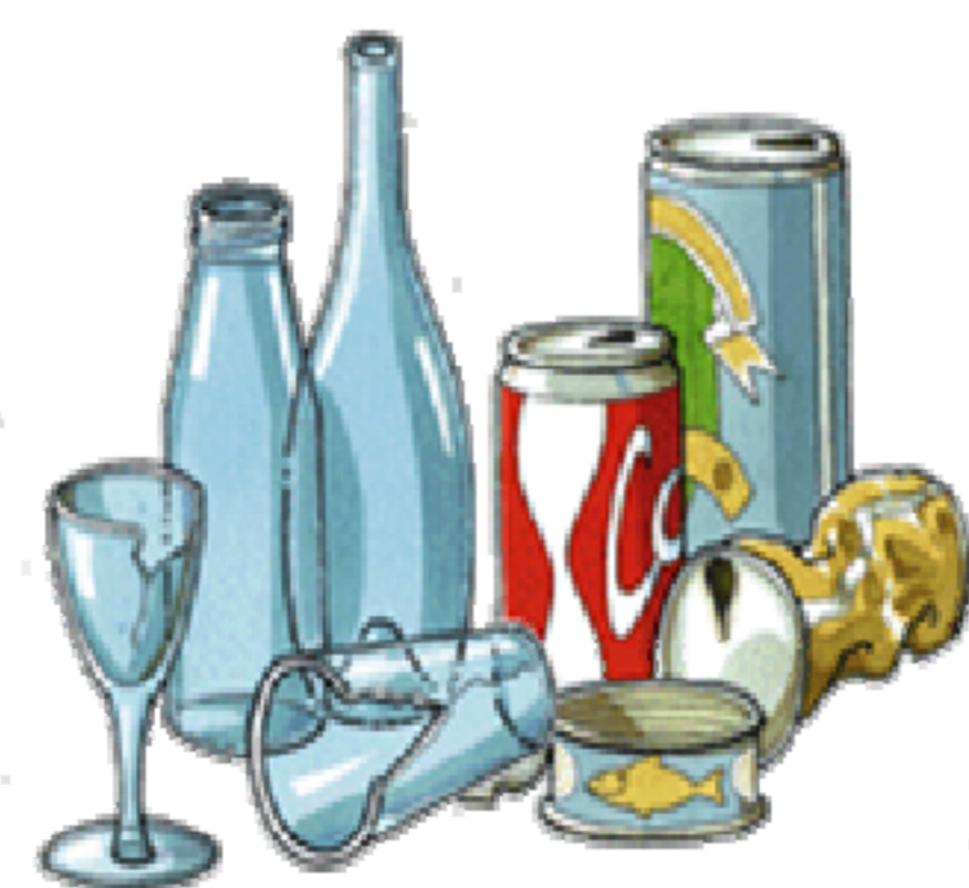
CASSONETTO VETRO E LATTINE